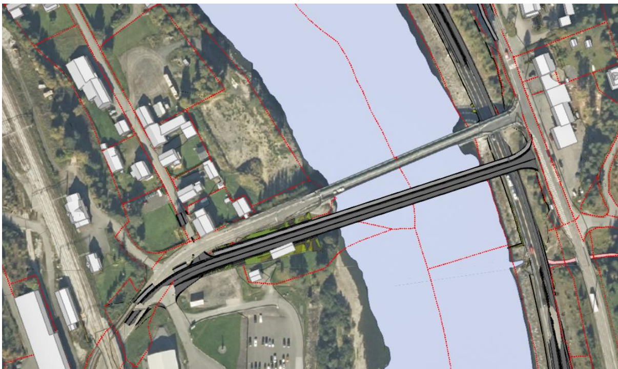
Figur 3-2 Alternativ 2 - Bru nedstrøms dagens bru

Alternativ 2 er bru tett nedstrøms dagens bru. Den nye vegen begynner på vestsiden av Lågen like før avkjørselen fra Musdalsvegen til meieriområdet (TINE), før den følger dagens trasé tett mot øst over gnr./bnr. 130/89. I øst treffer brua Kongsvegen ved sørenden av bygget til Circle K, noe sør for dagens kobling.