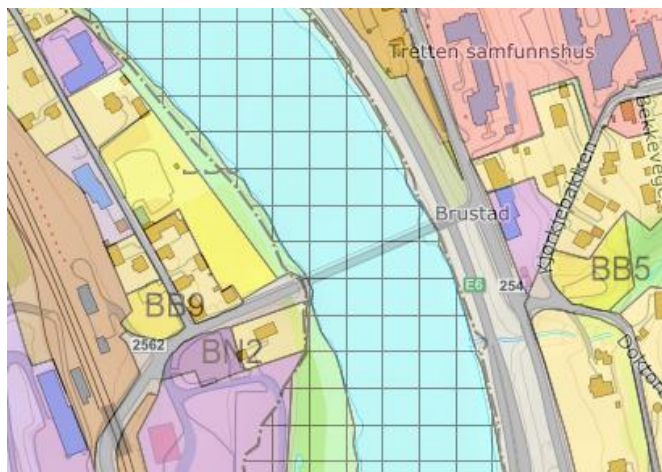
Figur 2-1 Utsnitt Kommuneplanens arealdel 2018-2028

I referat fra oppstartmøte påpeker Øyer kommune at tiltaket ikke er i tråd med kommuneplanen på grunn av avvik fra dagens bruplassering.