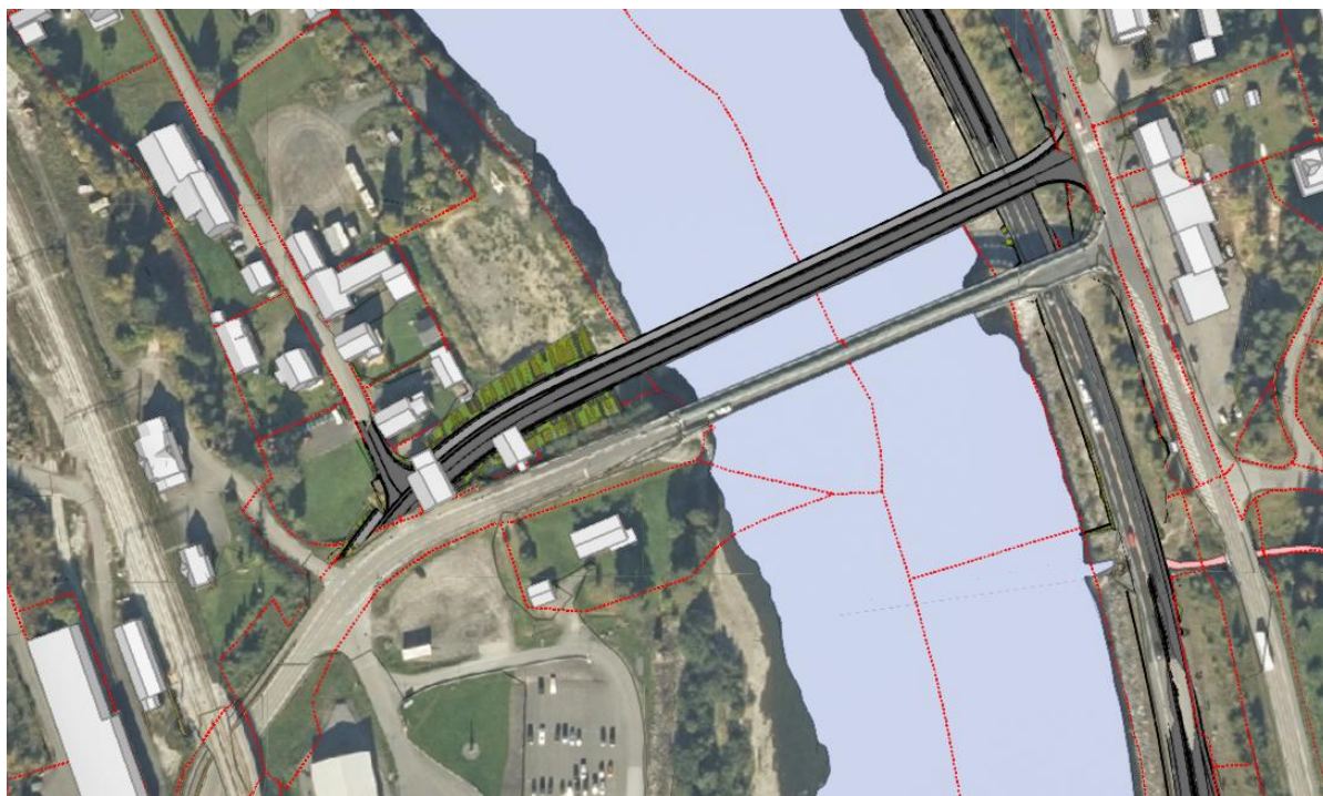
Figur 3-1 Alternativ 1 - Bru oppstrøms dagens bru

Alternativ 1 er ny bru tett oppstrøms dagens bru. På vestsiden av Lågen begynner ny veg like øst for adkomstvegen opp til Tretten stasjon og krysser gnr./bnr. 130/29 (Lågenvegen 1), der det vil etableres fyllinger. Fyllinger vil også etableres på gnr./bnr. 130/95 (Lågenvegen 3), der noe dyrka mark beslaglegges. På østsiden av elva treffer brua Kongsvegen noe lenger nord enn dagens kobling, ca. midt på vestsiden av eiendommen gnr./bnr. 97/57 (Kongevegen 1545).