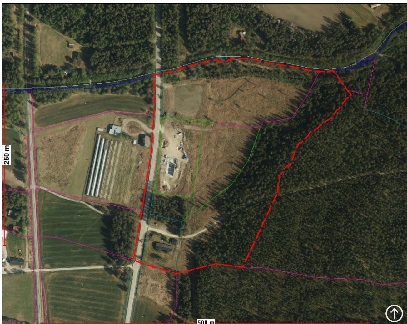
Figur 1: Planavgrensning – rød, stiplet linje, flyfoto, med eiendomsgrenser.

Planavgrensningen ligger innenfor LNF-område i nåværende kommuneplanens arealdel (KPA) for Alvdal kommune, vedtatt i 2009 og er innenfor en eldre, interkommunal reguleringsplan med Plan-ID 3427_R54/3428_R54.