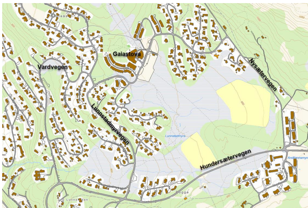
Kart med veisystemet i området ved Gaiastova

Tiltaket vil medføre trafikkøkning på Lunnstadmyrvegen, dersom denne blir valgt som adkomst til planområdet. Det vil bli utarbeidet en analyse som vil se på muligheter og utfordringer knyttet til eksisterende veinett, samt vurdere ev. behov for avbøtende tiltak, og vurdere løsning for myke trafikanter.