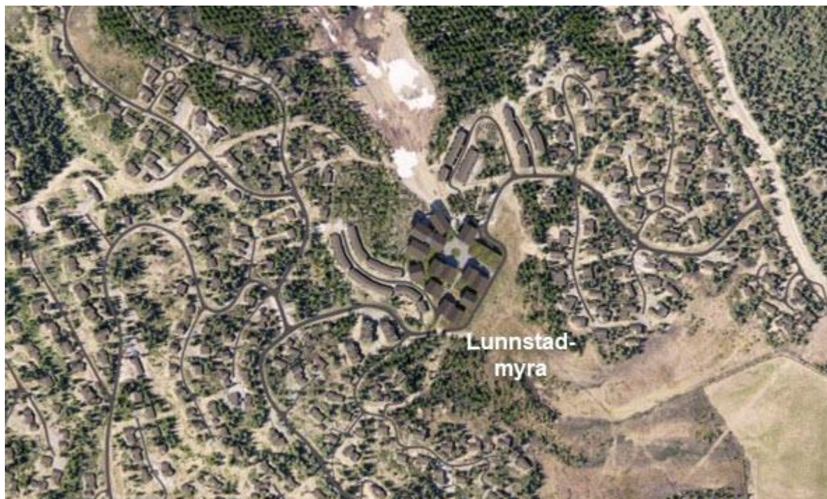
Skisse fra arkitekt som viser mulig ny bebyggelse og omlegging av vei østover

Det vil bli utarbeidet rapporter som vurderer temaet myr nærmere gjennom planarbeidet.