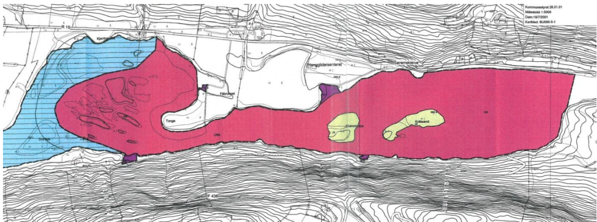
Figur 2: Utsnitt av del plankart for Reguleringsplan for Otta. Området med raud farge er regulert til spesialområde masseuttak