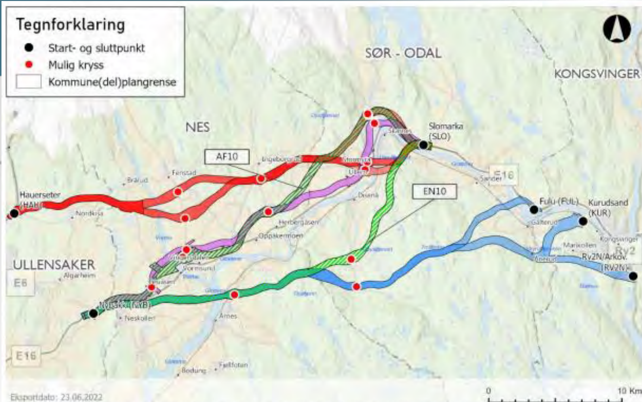
Figur 1-1 Oversiktskart med planforslaget som har vært på høring sammen med de to nye alternativene AF10 og EN10 som er markert med grønn skravur.