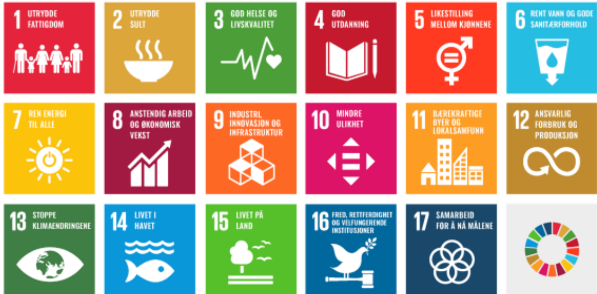
Figur 2. FNS 17 bærekraftsmål.

Bærekraftig utvikling handlar om å ta vare på behova til menneske som lever i dag, utan å øydeleggje framtidige generasjonar sine moglegheiter til å dekke sine. Bærekraftsmåla synleggjer dei tre dimensjonane i bærekraftig utvikling: klima og miljø, økonomi og sosiale tilhøve. Dei ulike bærekraftsmåla opptre ikkje individuelt, men heng saman. Det er derfor vanskeleg å peike på enkeltmål som kommunen skal fokusere på. Justerar ein innanfor det eine nivået, vil det ha effekt på dei andre, og tilhøyrande mål.