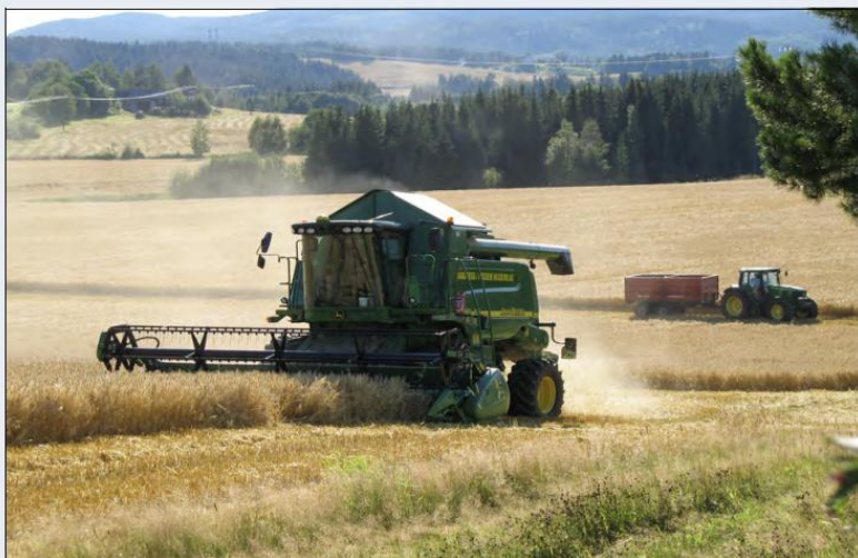
Figur 11.2 Tresking i Trøndelag

fredstid for å gi bedre sikring i krisetid. Innlandet vil gjennom piloten arbeide strategisk for å bidra til økt samhandling mellom verdikjedene for mat og beredskapsapparatet, som en del av styrkingen av totalforsvaret. Matkjedene er komplekse systemer med en lang rekke helt nødvendige funksjoner i form av kompetanse, teknologi, organisasjon, logistikk og innsatsfaktorer mm. Dette må henge sammen i fred og krise.