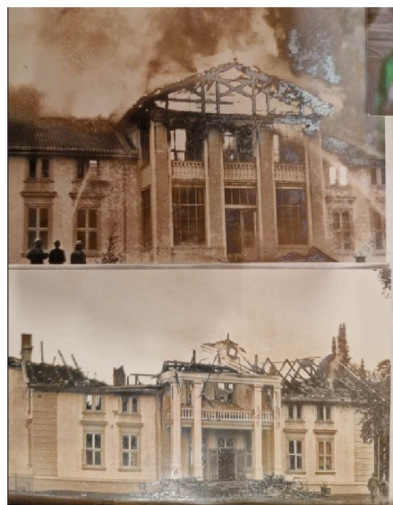
Bilde fra august 1973. Hovedhus totaltskadet.

Hovedbygget anses som totalrenovert og opprinnelsesårene for et bygg er ikke alltid relevant. I hvert fall ikke i dette tilfellet.